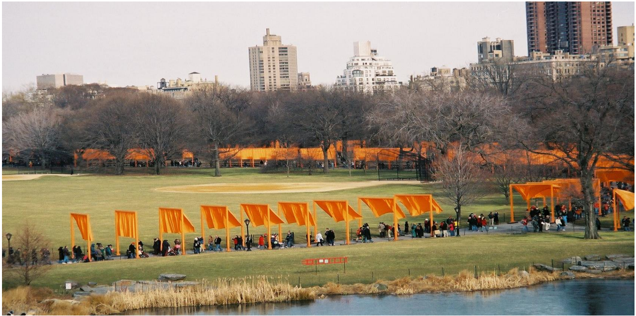
“The Gates”, Ciudad de Nueva York, febrero de 2005.

¿Qué podemos hacer para ayudar a los visitantes en esta búsqueda? ¿Cómo podemos involucrar a su imaginación, esa capacidad única y maravillosa de pensar en lo posible? Las herramientas que proveen la comprensión somática y la narrativa nos dan algunas respuestas. ¿De qué forma podemos preguntar y estimularles a preguntarse “¿qué tal si?” ¿Trabajar juntos en el modo subjuntivo?