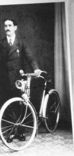
Identificado, ca. 1910 Identificado