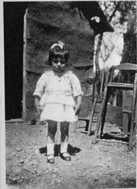
Niña en la calera de Colombo, 1921 Autor no identificado Donó familia Colombo

Dispositivo Digital PARA Fotografías Antiguas